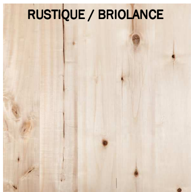
RUSTIQUE / BRIOLANCE

AB Aspect homogène , nœuds diamètre moyen 10 mm , légères différences de coloration