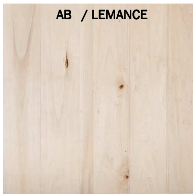
AB / LEMANCE